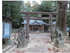
尾呂志神社 Oroshi Jinja (Shrine) About 15 minutes

A shrine believed to have existed before the Edo period. Festivals are also held in spring and autumn. 江戸時代以前からあるとされる神社。春と秋には例大祭もおこなわれます。