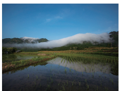
風伝おろし(撮影スポット) Fuden-Oroshi (shooting spot) About 10 minutes

■ Kuruu, Mihama-cho, Minamimuro-gun, Mie 三重県南牟婁郡御浜町栗須