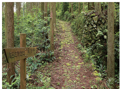
風伝峠入口(熊野古道) Fuden-toge entrance (Kumanokodo) About 15 minutes

■ 161-2 Ueno, Mihama-cho, Minamimuro-gun 三重県南牟婁郡御浜町上野161-2