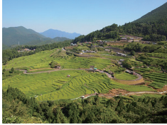
丸山千枚田 Maruyama Senmida About 15 minutes

It is Tanada consisting of about 1340 small rice paddies. You can enjoy the look of each season. 約1340枚の小さな水田からなる棚田です。四季折々の表情が楽しめます。