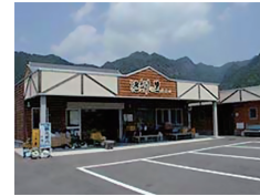
さぎりの里 Sagiri no sato (shop) About 10 minutes

■ 361 Kawase, Mihama-cho, Minamimuro-gun, Mie 三重県南牟婁郡御浜町川瀬361